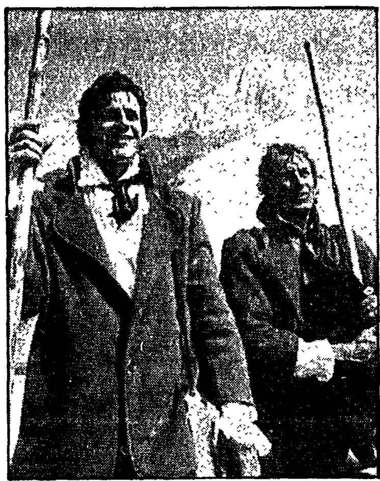
Due guide alpine negli abiti di Jacques Balmat (in alto a sinistra) e di M. Gabriel Paccard, i primi scalatori del Monte Bianco