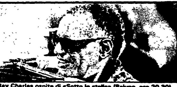
Ray Charles ospite di «Sotto le stelle» (Raiuno, ore 20,30)

Raiuno 13.00 MARATONA D'ESTATE - Internazionale di Danza 13.30 TELEGIORNALE 13.45 SILURI UMAM - Film con Raf Vallone