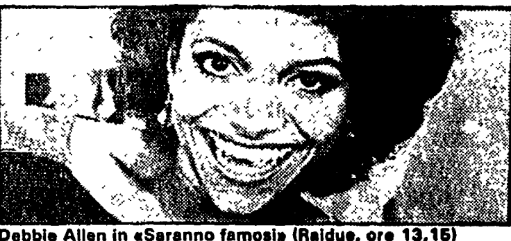
Debbie Allen in «Saranno famosi» (Raidue, ore 13,15)

Raiuno 13.00 MARATONA D'ESTATE - Internazionale di danza 13.30 TELEGIORNALE 13.45 PER POCCHI DOLLARI ANCORA - Film con Giuliano Gemma