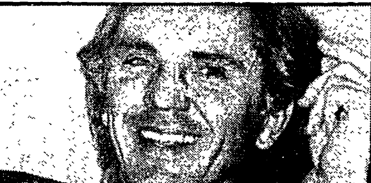
Terence Stamp in «Occhi di ghiaccio» (Raiuno, ore 21,30)

Raiuno 13.00 MARATONA D'ESTATE - Internazionale di danza 13.30 TELEGIORNALE 13.45 LE AVVENTURE E GLI AMORI DI OMAR KHAYYAM - Film con Cornel Wilde