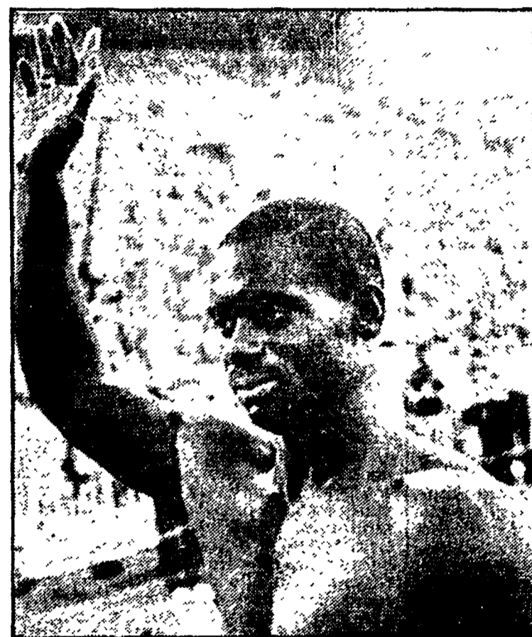
Ben Johnson ha umiliato Carl Lewis