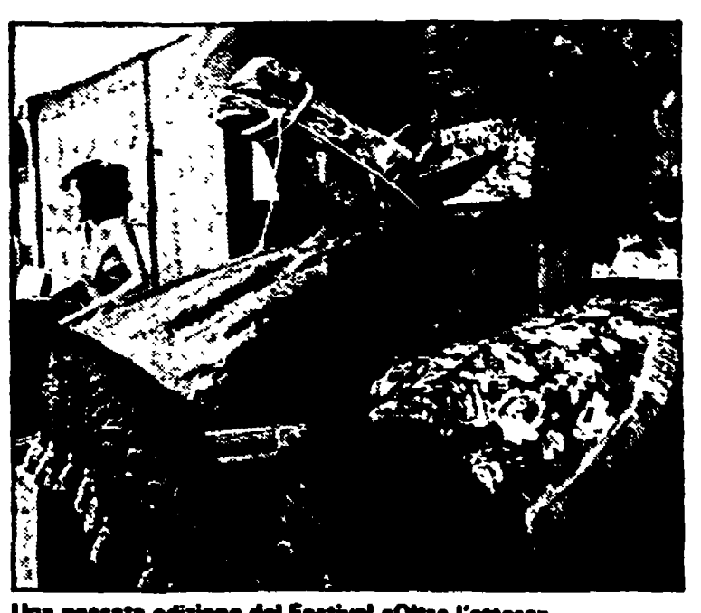
Una passata edizione del Festival «Oltre l'attore»

di Roma, il ministero Turismo e Spettacolo e i comuni di Monterotondo e Mentana. Questa edizione si svolgerà dall'11 al 14 settembre e sarà dedicata ad un confronto tra artisti italiani e olandesi. Rappresenterà l'Olan-