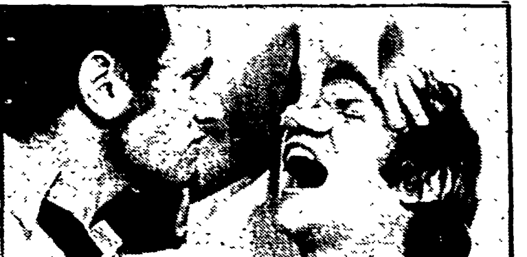
Una scena di «Arancia meccanica»

to nella storia cinematografica contemporanea, che ha espresso in modo piuttosto crudo i mallesseri e i sintomi negativi di una società moderna avviata all'autodistruzione e alla riproduzione spontanea di violenze e crimini.