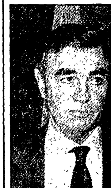
Dal nostro inviato