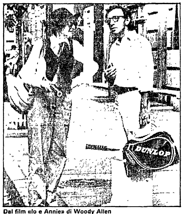
Dal film «Io e Annie» di Woody Allen

● UN MARE DI FILM — Conclusa la programmazione nelle arene di Formia, Gaeta, Ladispoli, S. Felice Circeo e S. Marinella, le pellicole continuano a scorrere negli spazi aperti di Roma e Rieti. Arena Esedra (Via del Viminale) oggi: «Indiana Jones e il tempio maledetto» di Steven Spielberg, con Harrison Ford e Kate Capshaw; domani: «La zona morta» di David Cronenberg, con Christopher Walker e Brooke Adams. Rieti, Nuovo Modernità — Oggi e domani: si ripete «Fuori orario» il più «europeo» del film di Martin Scorsese, interpretato da Rosanna Arquette, Griffin Dunne e Linda Fiorentino. ● CINEMA D'AMORE-CINEMA D'AUTORE — La rassegna a Ponte S. Angelo, ideata da Scripta Manent, propone questa sera (ore 23) il film «Io e Annie» di Woody Allen, domani «Chiari di donna» di Costa-Gavras. ● FORO ITALICO — La rassegna cinematografica ideata dentro i 1.000 giorni di sport (Stadio Centrale del tennis, ore 21.30, ingresso lire 2.000) offre oggi la visione del documentario «Campioni sotto mare» e del film «Scemo di guerra» di Risi.