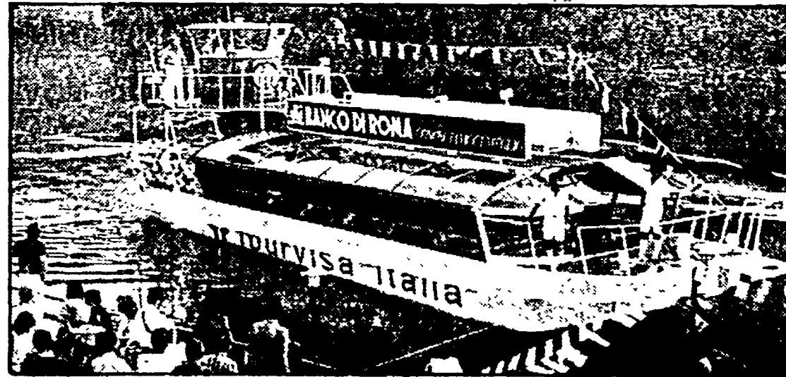
Il battello Tiberi usato nei viaggi fluviali di «Un fiume di stelle»

● SCRIPTA MANENT — L'iniziativa dei librai ambulanti a Ponte Sant'Angelo che doveva essere una semplice piccola Porta Portese del libro, messa in piedi per denunciare il futuro incerto dei librai nel centro storico, è diventata un momento culturale di non poca importanza. Sulla piccola «arena» di sedie pieghevoli allestita al centro del ponte si susseguono avvenimenti di carattere letterario, teatrale e musicale. Fino ad oggi ci sono state letture di poesia con Dario Bellezza, Elio Pecora, Bianca Maria Frabotta, Amelia Rossetti e altri. Nei giorni scorsi è stata ricordata la figura poetica di Sandro Penna. Tutte le sere vengono proiettati film su monitor e da giovedì, alle 23, è partita la rassegna «Cinema d'amore, cinema d'autore», sette grandi film per sette sere. In questo modo «Scripta Manent» si è conquistata una fetta di pubblico romano e di turisti indicando una via d'uscita, intima e di qualità, in tempi di così magra fantasia. «La manifestazione è autofinanziata e non c'entra niente con le vacanze in città», tengono a precisare gli organizzatori, che d'inverno solitamente posteggiano a Fontanella Borghese, all'Università e a Porta Portese. A settembre la manifestazione sul Ponte Sant'Angelo ospiterà Alberto Moravia, Dacia Maraini e il cantautore francese Leo Ferré. Inoltre, sarà organizzato un premio di poesia «Ponte degli Angeli» e un ciclo di incontri sul gioco con Ennio Peres.