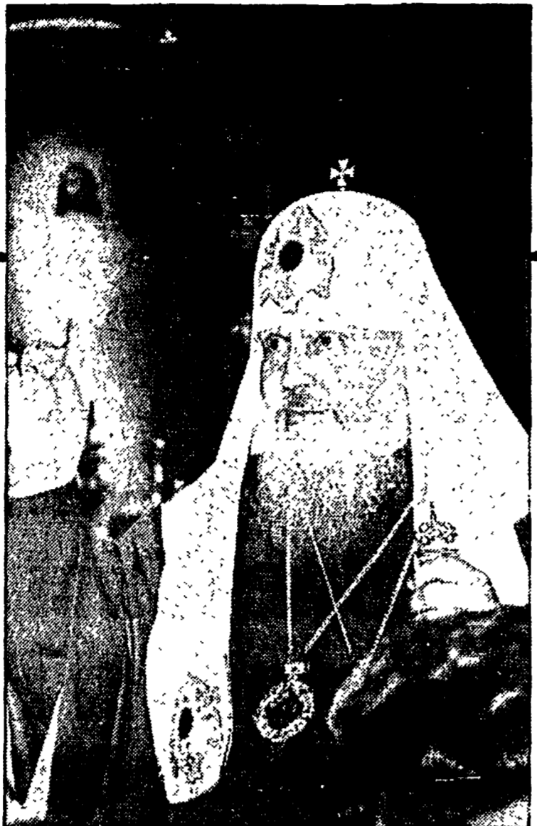
Il Patriarca di Mosca e di tutte le Russie, Pimen

Pimen parla per la prima volta su un giornale occidentale Confermato il viaggio ad ottobre in Italia «Preghiera comune sulla pace» Critiche alla «Dominum et vivificantem»