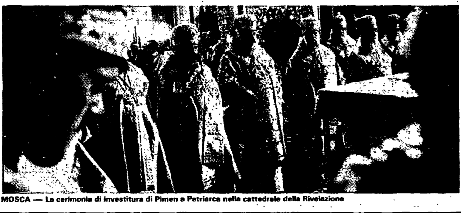
MOSCA — La cerimonia di investitura di Pimen e Patriarca nella cattedrale della Rivelazione

«Creano notevole perplessità alcune parti della enciclica di Giovanni Paolo II...» «Noi verremo ad Assisi ma quell'enciclica...» «Noi siamo rammaricati per questa posizione di Wojtyla...»