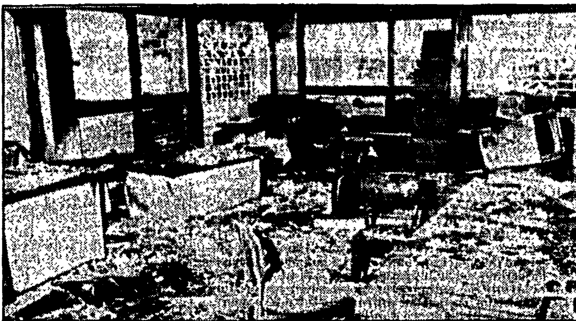
LECCE — La sede Enel dopo l'attentato

Dopo le polemiche dei giorni scorsi sulla centrale a carbone di Cerano un episodio di violenza - Scritte contro l'ente sui muri