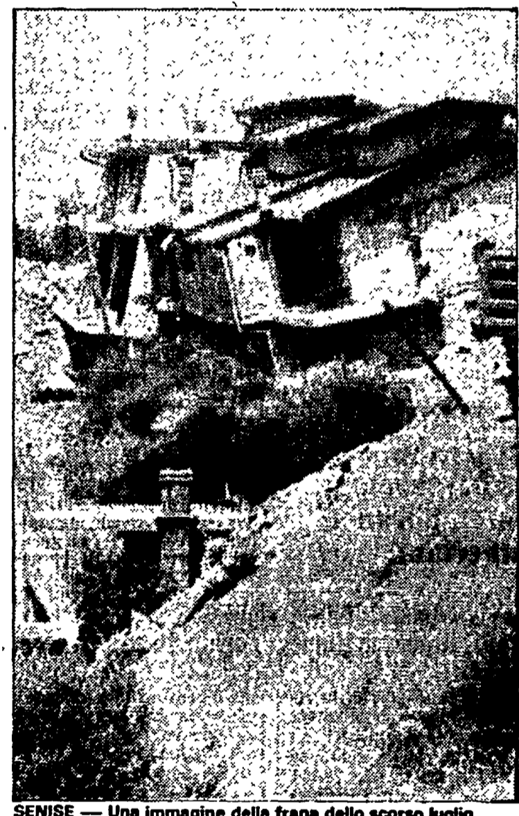
SENISE — Una immagine della frana dello scorso luglio