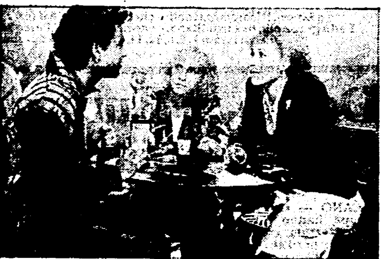
Un'inquadratura di «Bella in rosa» di John Hughes