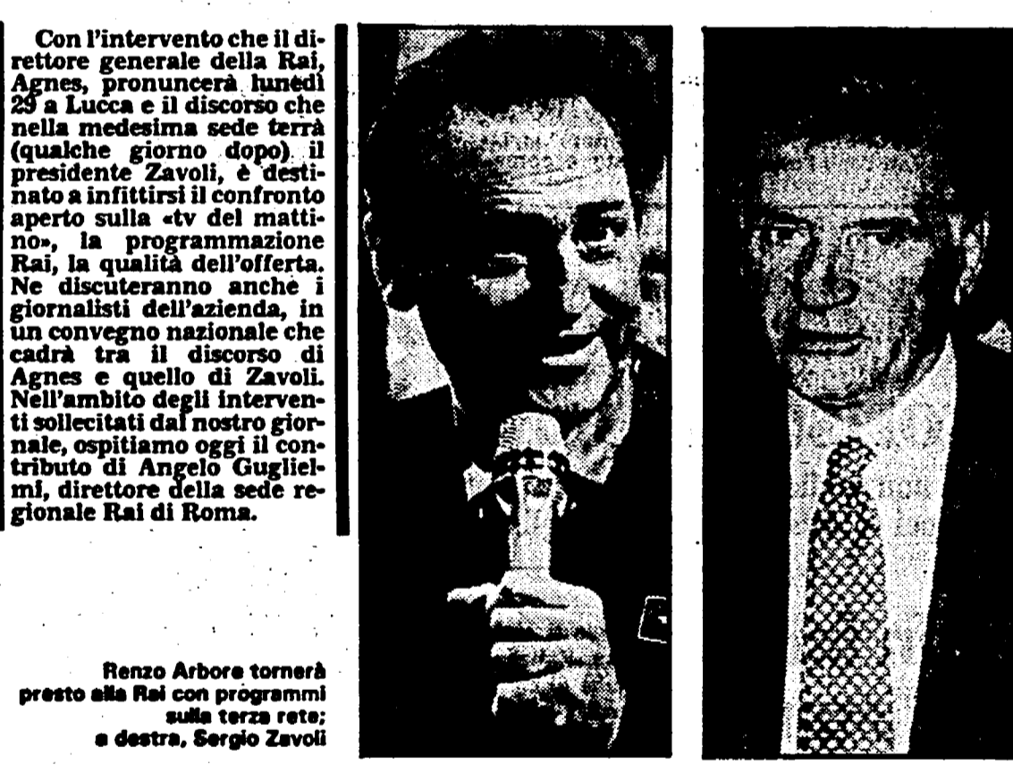
Renzo Arbore tornerà presto alla Rai con programmi sulla rete; a destra, Sergio Zavoli

Da alcune settimane è in corso un dibattito (fin troppo acceso) sulle presunte novità di programmazione che le tre Reti Tv della Rai offrirebbero a partire dalla ripresa autunnale.