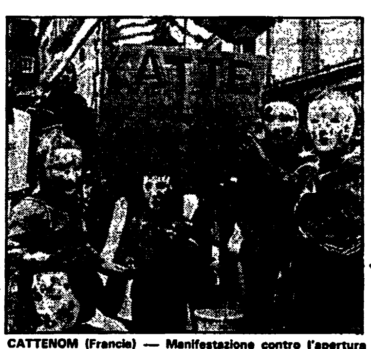
CATTENOM (Francia) — Manifestazione contro l'apertura della centrale nucleare