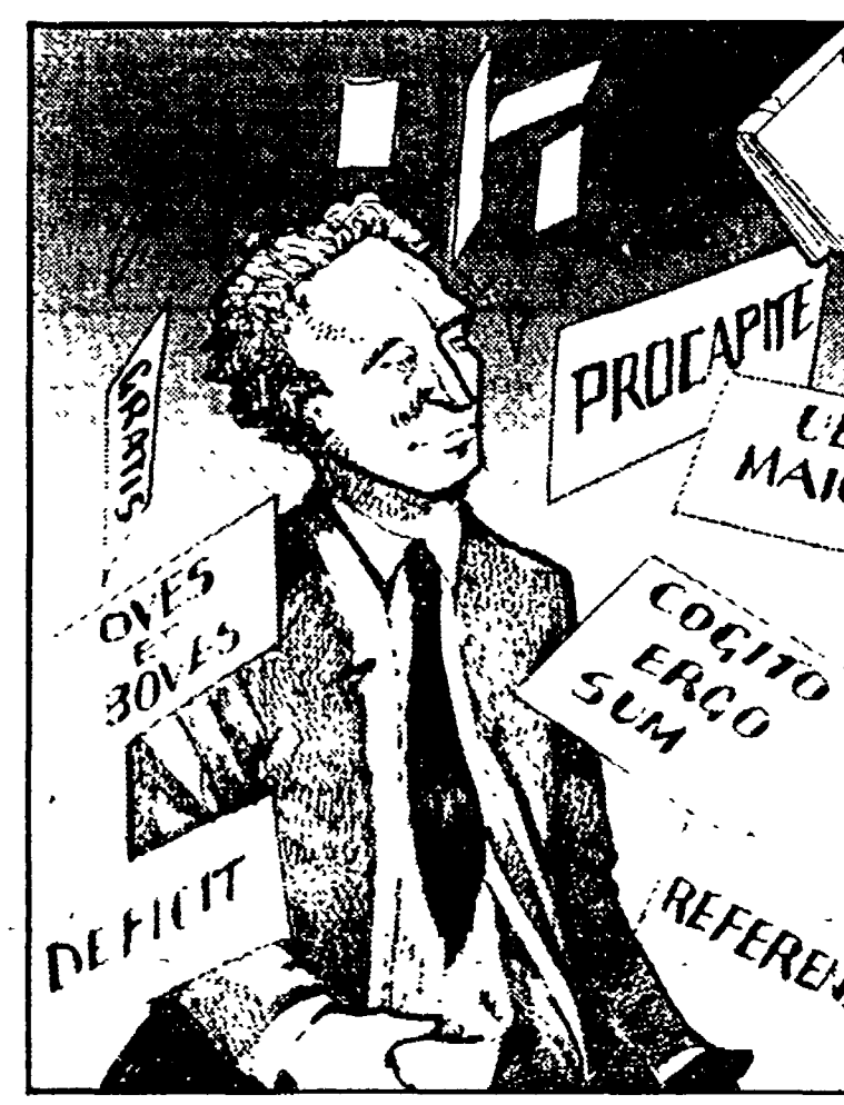
Un disegno di Giulio Peranzoni

Ma venendo al dunque, consigliamo di evitare questo libro perché siamo convinti che sia sempre da evitare la volgarità e la saccente che normalmente dominano le chiacchiere da salotto, pronte a sentenziare su tutto perché incapaci di appropinquare alle cose. Ma anche, sconsigliamo questo perché il senso comune che da la trasuda è così insopportabilmente abbonda, da scacciare qualsiasi voglia di godere della citazione latina, in quel senso comune mistramente adingata. Chiacchiere vuote, fa-