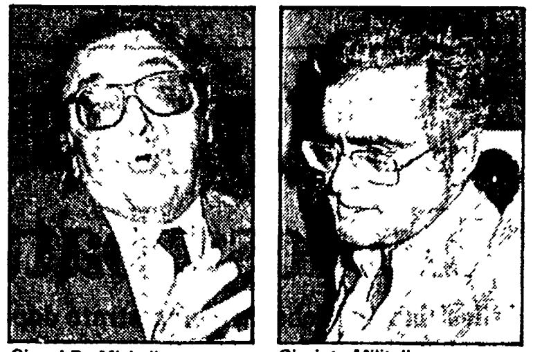
Gianni De Michelis

Qualche altro passaggio dell'intervista è dedicato alle prospettive di nuovi investimenti stranieri nel nostro paese. «In Italia c'è posto per tutti - dice Andreotti - salvo che per i monopoli. Credo che un pluralismo effettivo articolato