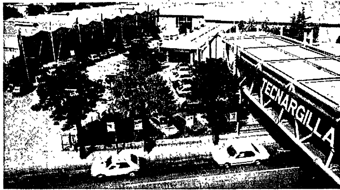
Una veduta panoramica di Tecnargilla.

ramico. Già 6.000 aziende (le più importanti nel mondo) hanno ricevuto un catalogo, a cura di Tecnargilla, in cui figurano i macchinari e le tecnologie che offre l'Italia nel settore. Nei giorni di fiera saranno all'undicesima edizione di Tecnargilla delegazioni ufficiali di operatori esteri: 120 dal Brasile, 12 dal Portogallo, 25 dall'Ungheria, 15 dalla Thailandia, 10 dalla Malaysia, 10 dall'India, 12 dal Messico, 15 dagli Stati Uniti, 10 dalla Corea del Sud ed infine 22 dalla Spagna. L'organizzazione di tali delegazioni è stata anche possibile grazie all'impegno dell'Istituto per il Commercio Estero (I'ce) che ha contribuito alla promozione del Salone. L'Ice sarà presente in fiera.