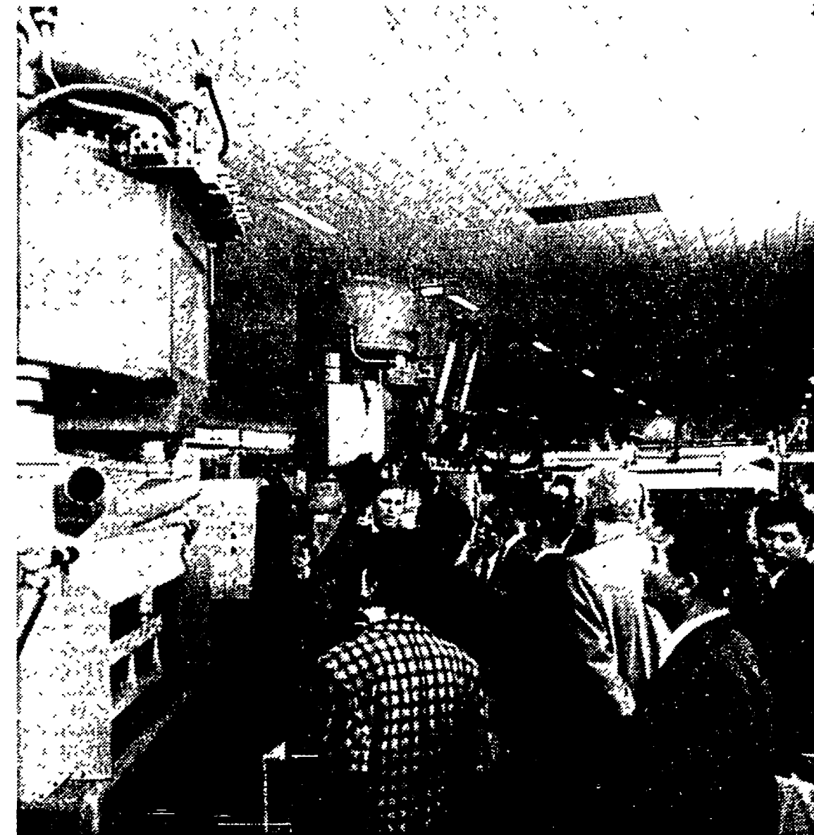
Visita ai macchinari di «Tecnargilla»

Per capire quanto sia importante Tecnargilla, basti pensare al fatto che nel biennio '84-85 solo le aziende italiane di piastrelle hanno speso circa 650 miliardi di lire. specializzate nella produzione di impianti, macchinari, attrezzature, forni, decorazioni, smalti, colori e materie prime. Si tratta di un settore in espansione, l'edizione dello scorso anno aveva avuto un esito veramente soddisfacente evidenziando come il settore della stoviglieria sia oggi in espansione in varie aree mondiali sia per il maggiore utilizzo del prodotto che perché rappresenta un utile terreno di diversificazione produttiva per le aziende ceramiche. Il settore della stoviglieria in Italia occupa 25.000 addetti con una produzione annua di circa 40 milioni di pezzi ed un fatturato di 1800 miliardi di lire.