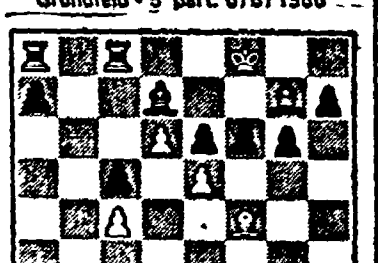
Dopo 18. mossa

KARPOV (bianco)-KASPAROV (nero) Gamberetto di Donna - 8ª part. 15/8/1986 1. d4D5; 2. c4E6; 3. Cc3A7; 4. c5E5; 5. A4C6; 6. Dc2g6; 7. e3A15; 8. Dd2C7; 9. 13C08; 10. e4A6; 11. e5A5; 12. A3D4; 13. B3A4; 14. g3A7; 15. R1A15; 16. A1R18; 17. Rg2A5; 18. a2D8; 19. C3A3; 20. R3R7; 21. Rg2C7; 22. A5C18; 23. Ae3C6; 24. Cc2C6; 25. b4D8; 26. Ae3C6; 27. Cc2C6; 28. Ah6T6; 29. C5D5; 30. Ae4A4; 31. T1f1h3; 32. h3T3; 33. T1h1T1; 34. R1A15; 35. f4Tc5; 36. f5T5; 37. A5D5; 38. R2D5; 39. T1D5; 40. D1C5; 41. D4R6; 42. A4R6; 43. D4R6; 44. R5, patto