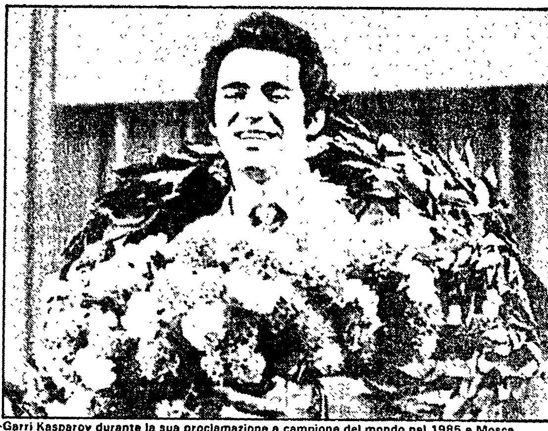
Garry Kasparov durante la sua proclamazione a campione del mondo nel 1985 a Mosca

prima parte lo svantaggio di un punto non pareva comunque impensierito. Invece, proprio a Leningrado, città amica a Karpov dove si è laureato in economia e ha costruito il suo successo, si consuma la pesante sconfitta di due partite nelle prime quattro. Quando tutti consideravano chiuso l'incontro una tripletta, storicamente unica, vincente su Kasparov, riportata in ballo il risultato. Forse più per un Karpov sopra le righe che per una forza di gioco dello sfidante che ha dimostrato comunque una notevolissima capacità di reazione. Infine una serie di patte prima del risultato, ma Karpov ha inflitto a Kasparov in contropiede proprio mentre questi cercava di forzare il risultato. Kasparov si conferma quindi il più forte alla luce del risultato, ma Karpov ha sfoggiato una grinta e determinazione non comuni. L'incontro è stato caratterizzato anche dal clima disteso e molto sportivo che ha contraddistinto i due gioca-