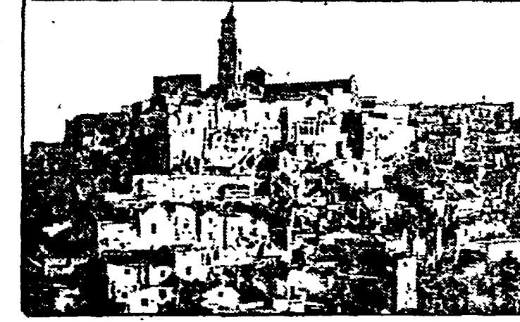
MATERA — La zona dei «Sassi» che sarà ristrutturata