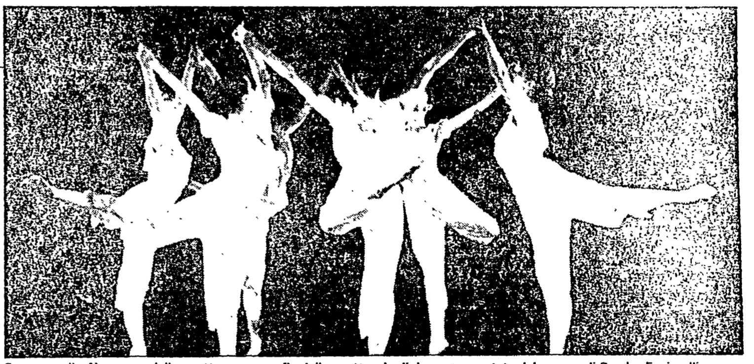
Sequenza di «Aire», una delle quattro coreografie dello spettacolo di danza presentato dal gruppo di Sandra Fucinielli

Il programma dello spettacolo che Sandra Fucinielli ha presentato al Laboratorio universitario di piazzale della Farnesina, comprendeva quattro brevi coreografie: «Tendre», con musiche di Vivaldi, il tempo di ritorno, con musiche di Massimo Cosen, «Una donna e l'amore: le canzoni di Edith Piaf» e «Aire» su musiche di Bach e Vivaldi.