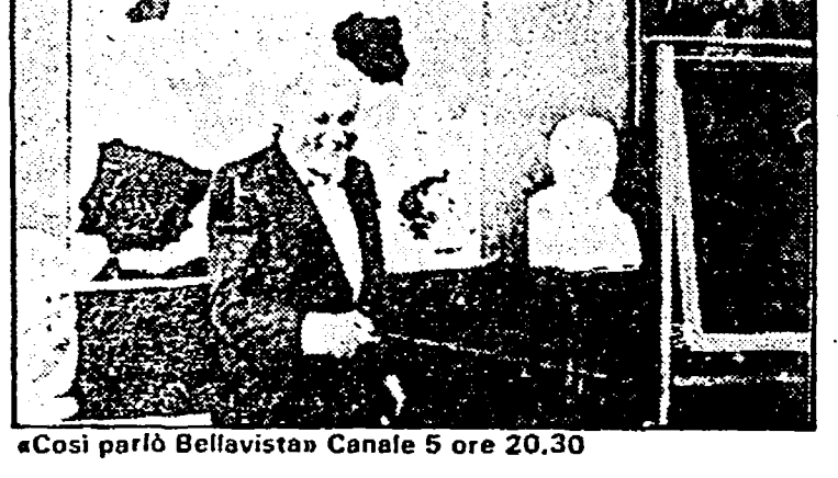
«Così parlò Bellavista» Canale 5 ore 20.30