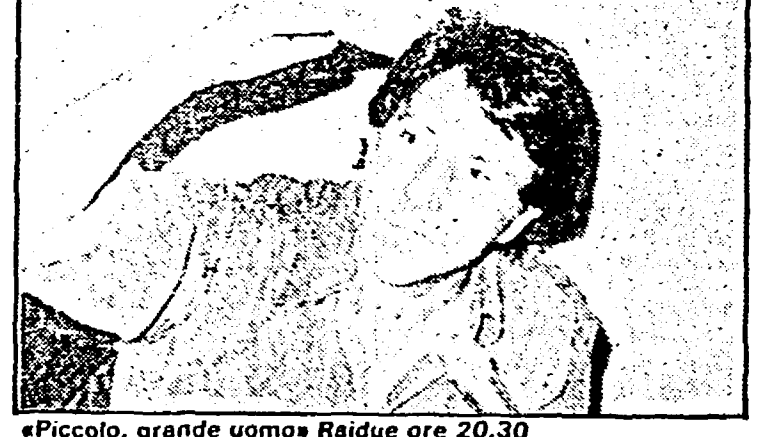
«Piccolo, grande uomo» Raidue ore 20.30