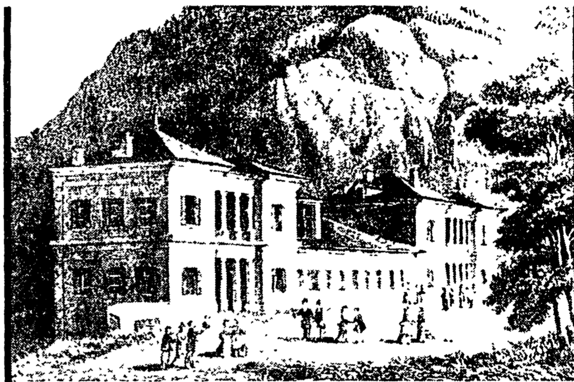
Una stampa dell'Ottocento delle Terme di Pré-Saint-Didier. Il rilancio termale è fondamento per lo sviluppo del paese e della intera Valdigne

Quindi per il turismo in Valle abbiamo tante cose da fare tutti assieme: dobbiamo soprattutto recuperare il gap commerciale nei confronti della concorrenza sempre più aperta. Dobbiamo adottare tutte quelle tecnologie di avanguardia che ci possono aiutare, per esempio abbiamo con ottica turistica a creare il nostro sistema di prenotazione centralizzata e automatizzata per l'utenza Valle d'Aosta collegata in tempo reale con i grandi sistemi nazionali ed internazionali. Dobbiamo fare aggressive, qualificate azioni