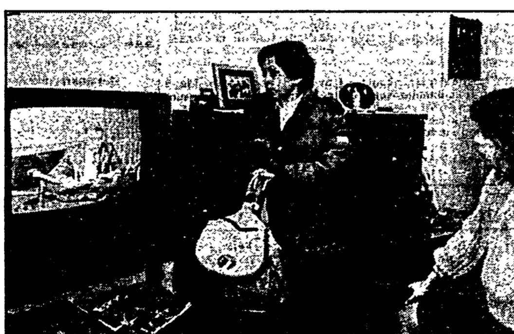
ROMA - Ore 7.30, madre e figlio ascoltano il primo telegiornale della mattina