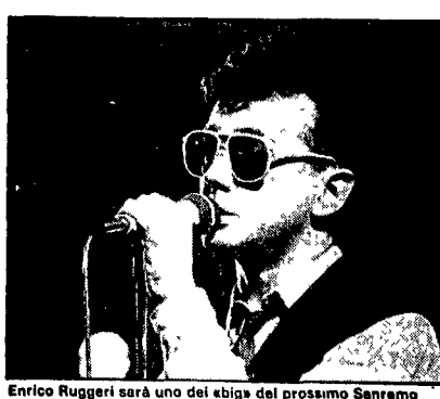
Enrico Ruggeri sarà uno dei «big» del prossimo Sanremo