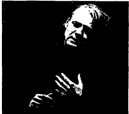
Bruno Ganz protagonista del «Prometeo incatenato»