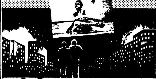
ROMA, TEATRO TRIANON, 4 FEBBRAIO / 1 MARZO 1987

BALLET ZERO - FAISO MOVIMENTO - CYNTHIA FUMANO - GIU' IPOCRITI - IL SOLE E LA LUNA - LIBERA GENNA ENSEMBLE - BRUNELLO LEONE - LIBERA GENNA ENSEMBLE - ENZO MOSCALO - MOVIMENTO DANZA - NUOVO TEATRO CONTROL - ENZO MOSCALO - MOVIMENTO DANZA - SCENARIO POESIA - SCENARIO ROCK - SILVANA SPINA - SINAPSI - TRADEMARK - WORK - DANCE