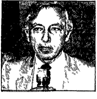
Il professor Robert Gallo, fra i maggiori esperti di Aids. Sotto: uno dei manifesti della campagna di prevenzione diffusa dal governo inglese

La verità è che nonostante il ministro continui ad affermare che «dopo le iniziative prese la gente che si comporta responsabilmente non corre rischi...»