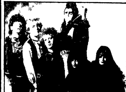
Il gruppo «Doctor and the Medics»