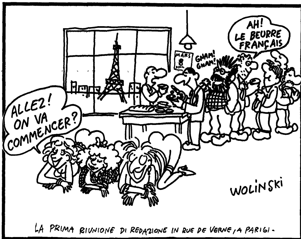
LA PRIMA RIUNIONE DI REDAZIONE IN RUE DE VERNE, A PARIGI.