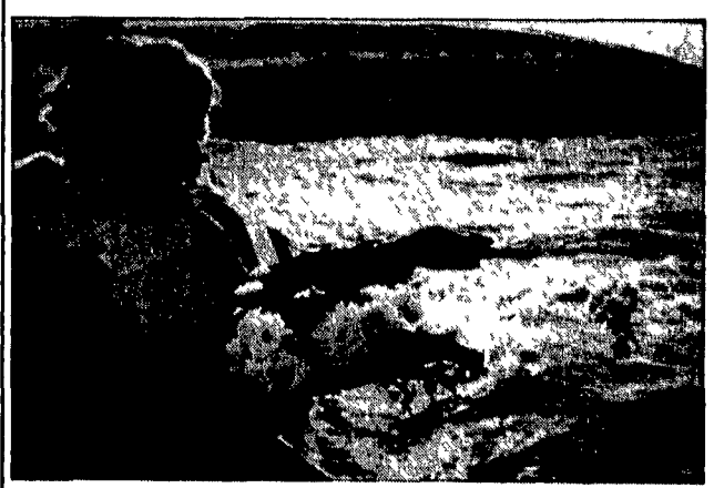
Un familiare delle vittime del disastro di Zeebrugge getta un fiore in mare

pm Poi si passerà a sei udienze. È prevista una pausa di cinque giorni per le feste pasquali dal 21 aprile, e un altro breve riposo di nove giorni in agosto dal 19 al 27.