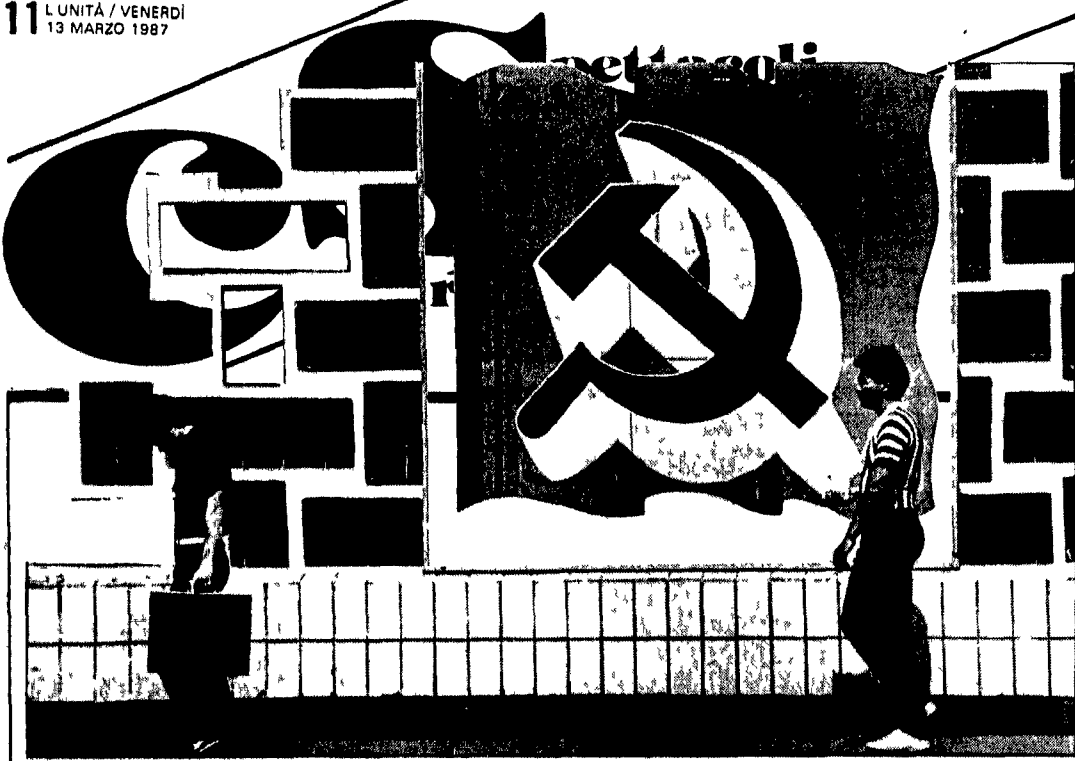
L'Urss di Gorbaciov è un libro ancora da scrivere? Il segretario dell'Unione scrittori Karpov parla del «nuovo corso»: Pasternak, i dissidenti, il realismo socialista...