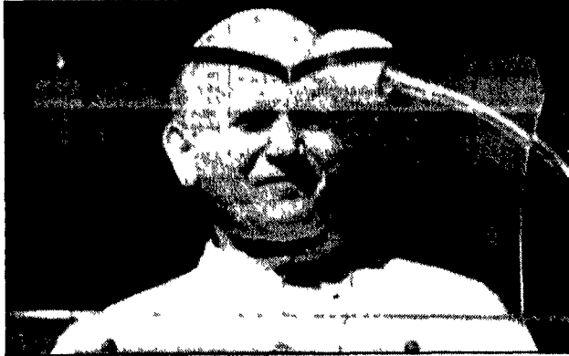
Giovanni Paolo II alla finestra del suo studio privato, protetto dal leggio antiproiettile