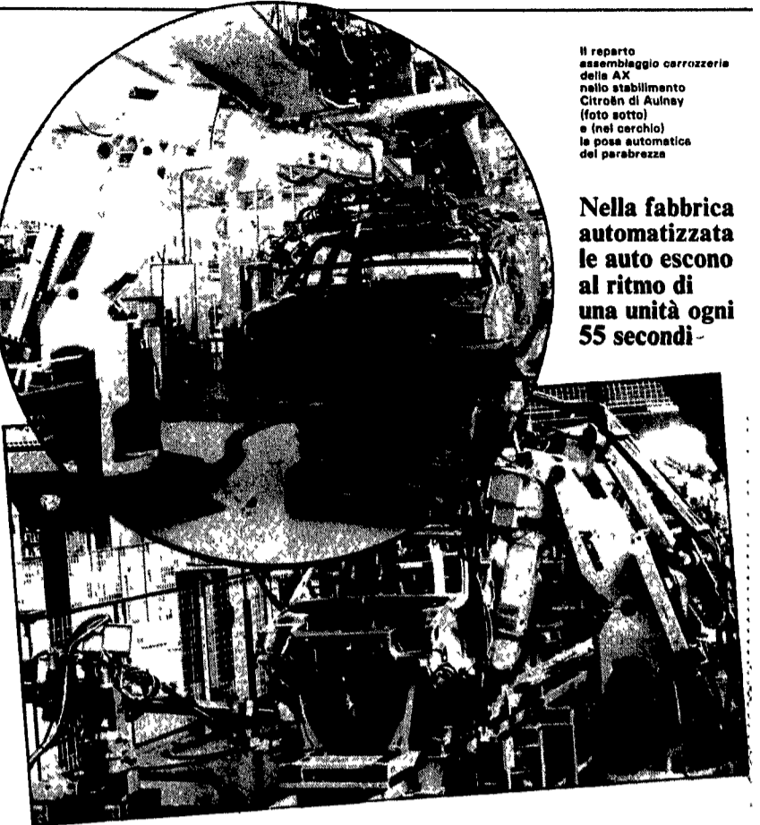
Il reparto assemblaggio carrozzeria della AX nello stabilimento Citroën di Aulnay (foto sotto) e (nel cerchio) la posa automatica del parabrezza

La quota di partecipazione di lire 300.000 a persona e comprende due giorni di pensione completa al Ciocco Hotel una serata con cena rustica, lezioni teoriche e pratiche di guida con le Suzuki DR 600.