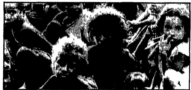
DILI - Bambini di un villaggio timorese in una foto di qualche anno fa. Una delle poche disponibili data la politica governativa che limita fortemente la libertà di stampa

Dal nostro inviato GIAKARTA - «Si la maggioranza dei prigionieri politici è stata liberata nella seconda metà degli anni settanta...»