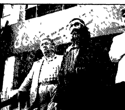
Inquadramento del film georgiano «Il nuotatore» presentato a Sanremo

Il secondo di qualunque oggetto culturale si chiacchiera sempre cogliendolo l'elemento un po' salottiero e di successo, facendo di questo un valore rispetto a tutti gli altri contenuti.