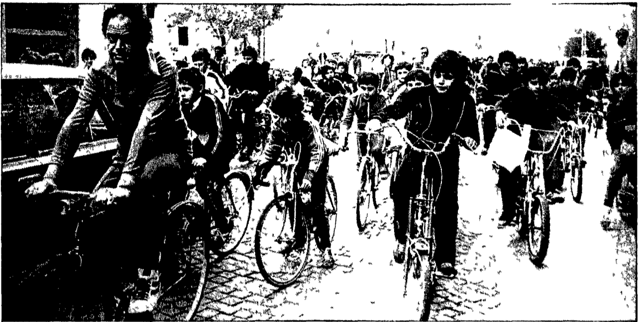
Ecco le città in cui si gareggia

Il 20 aprile una nuova grande manifestazione viene ad aggiungersi a quelle della «Primavera ciclistica» facendo da prologo al «Liberazione» e al «Regioni», le due corse «mondiali» del nostro giornale. Insieme uomini, donne, giovani e anziani e per chi ama l'agonismo ci sarà anche un km a cronometro