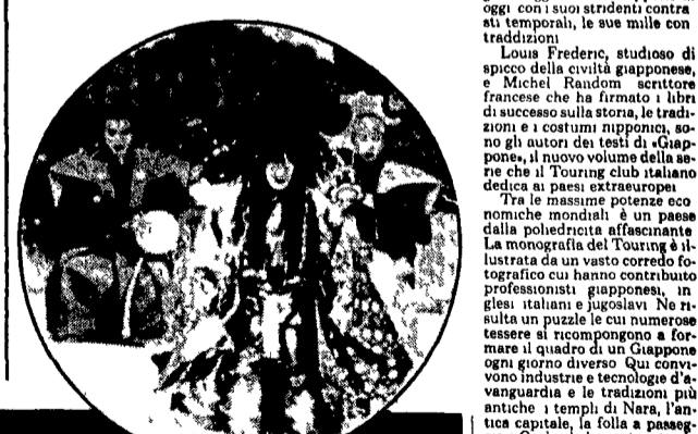
La guida ha 228 pagine, 174 fotografie a colori, allegata una grande carta geografica in scala 1:2.500.000 dell'arcipelago...

Nel suo palazzo carico di memorie antiche il novantenne imperatore Hirohito passa le giornate tra i libri o studiando con passione i muscoli allegati in un grande acquario...