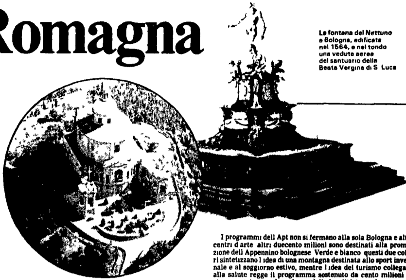
La fontana del Nettuno a Bologna, edificata nel 1564, e nel tondo una veduta aerea del santuario della Beata Vergine di S. Luca