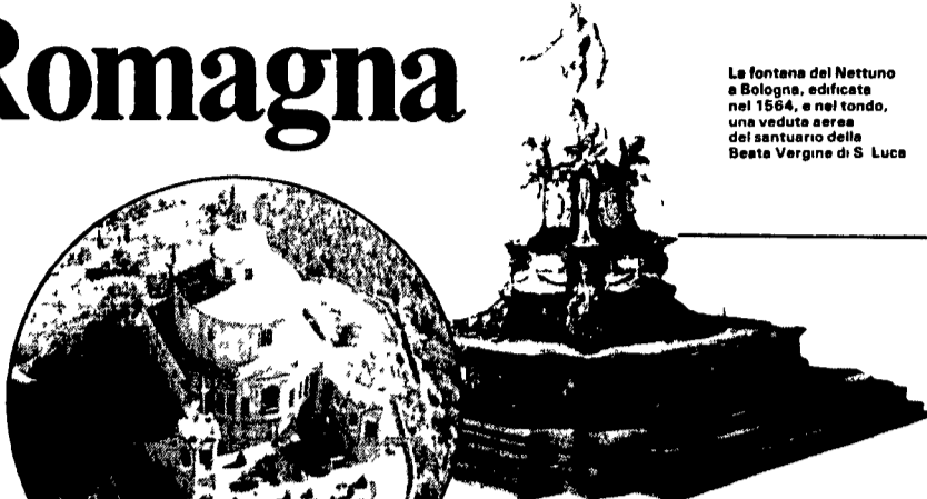
La fontana del Nettuno a Bologna, edificata nel 1564, e nel fondo, una veduta aerea del santuario della Beata Vergine di S. Luca