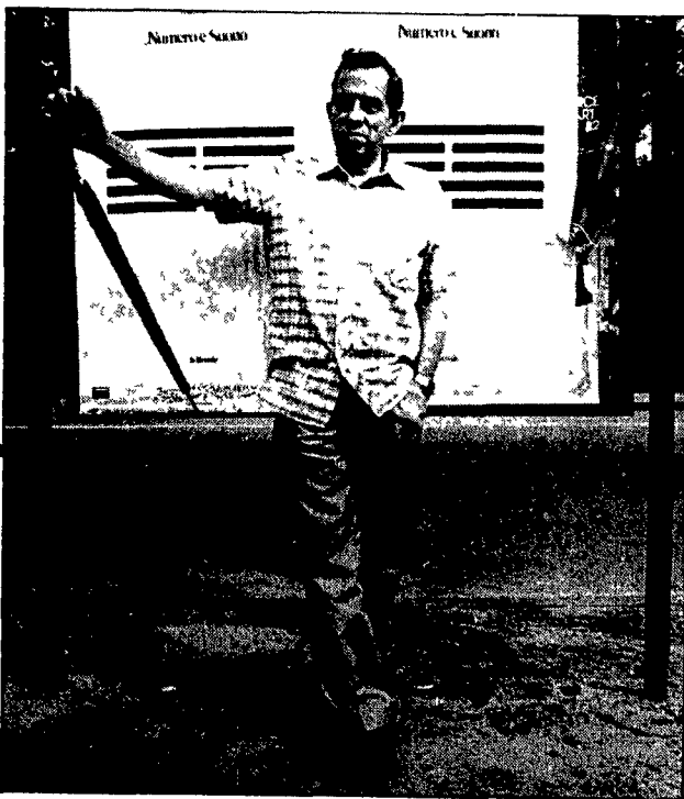
Il compositore di musica d'avanguardia Aldo Clementi