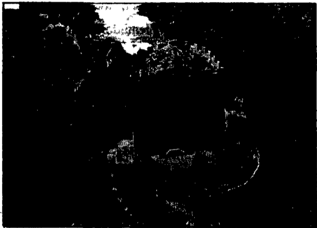
Un'immagine dell'isola di Capraia

Per ogni sguardo di tappa sono programmate manifestazioni collaterali. Il «Trofeo velico dell'arcipelago» è promosso dai comuni di Grosseto e Livorno, con il patrocinio del ministero dell'Ambiente, della regione Toscana, degli enti per il turismo delle due province e dall'associazione