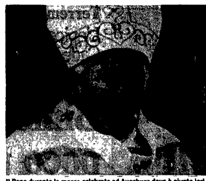
Il Papa durante la messa celebrata ad Augsburg dove è giunto ieri