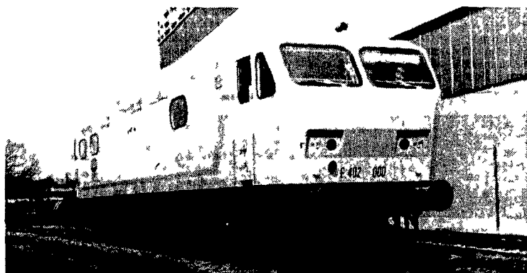
Due delle produzioni di maggior prestigio attualmente il locomotore sperimentale E402 ad alta velocità e (sopra) un grande impianto per lo scarico di materiali vari.

piattaforme che hanno cessato in questa nuova attività di produzione o sfruttamento dei giacimenti petroliferi.