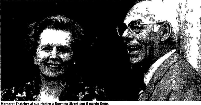
Margaret Thatcher al suo rientro a Downing Street con il marito Denis

Kinnock impugnerà fino in fondo delle sue doti di leader che ha fatto del laburismo «un partito più unito e più forte» più vicino ed «ascolto» con gli interessi delle masse popolari per interrompere un ciclo di caduta e recuperare una «qualità di vita» compromessa dalla Thatcher. L'alleanza liberal socialdemocratica propone a sua volta un programma di ripresa che metta fine alla «divisione del paese». Il suo obiettivo è di avanzare sulle grandi fasce elettorali intermedie strappando voti con un appello moderato tanto ai conservatori che ai laburisti così da impedire una affermazione assoluta dei due maggiori partiti costituenti un governo di coalizione. Per la prima volta in cinquant'anni è una prospettiva che l'attuale incertezza dell'elettorato britannico rende plausibile.