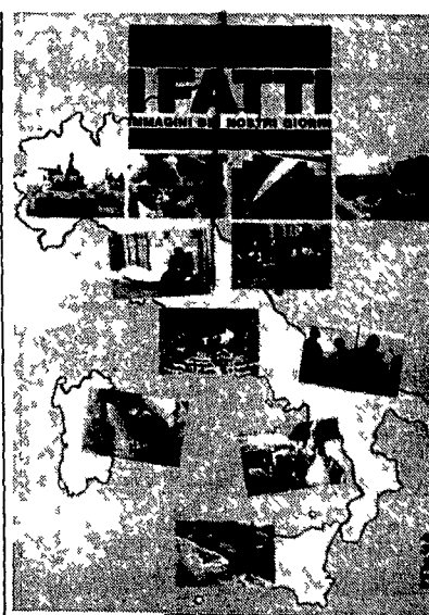
Domenica un rotocalco in omaggio Diffusione 1 milione di copie

giato tutta l'East Coast fino in Florida fatto il giro completo del Golfo del Messico superato lo Yucatan. Dopo otto settimane di crociera nei Caraibi e il rifiuto allo scarico da parte di sei Stati e tre paesi la chiatte è tornata a Brooklyn. Sta diventando quasi un simbolo dei problemi dell'America. mezzo di tonnellate di spazzatura. Quella di Islip e una discarica in mare. Quella principale sarà piena nel 2000 e il portavoce della nettezza urbana municipale Ma non è automatico che più si e nechi più facile e trovare soluzioni. Inquinamento e ambiente sono - secondo lo stonco Arthur Schiller - tra i problemi più urgenti. I che gli Stati Uniti dovranno affrontare prima che finiscano gli anni 80. Accanto all'ampliarsi delle diseguaglianze sociali alla moltiplicazione dei poveri alla popolazione strutturale all'inflazione (incomoda ad aumentare in modo impressionante) al declino dell'industria ai