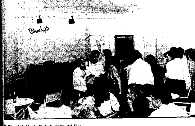
Il Blue Lab Music Club di vicolo del Fico