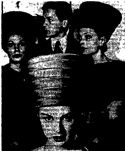
Roberto Capucci con le sue modelle, Roma 1961.

Adesso che l'immagine italiana, espresa dalla moda, ha raggiunto l'apice del successo in tutto il mondo, è interessante guardare indietro e ripercorrere le tappe. È anche un modo di capire i cambiamenti del gusto, dei ritmi di