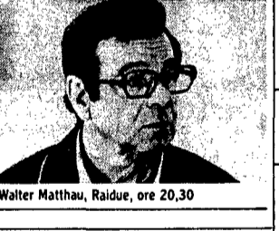
Walter Matthau, Raideu, ore 20,30