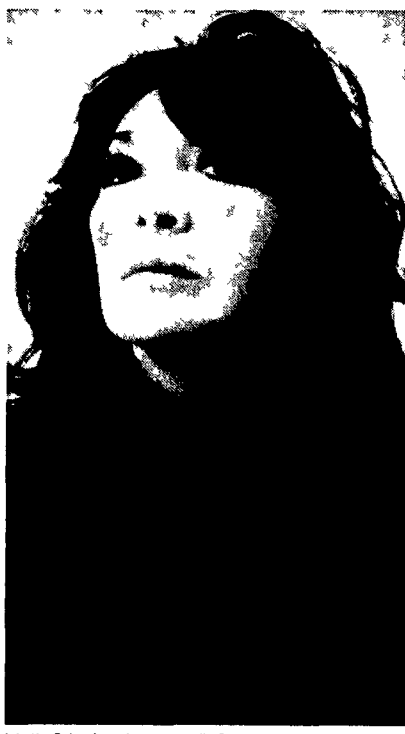
Juliette Gréco è ospite stasera di «Pentatlon»