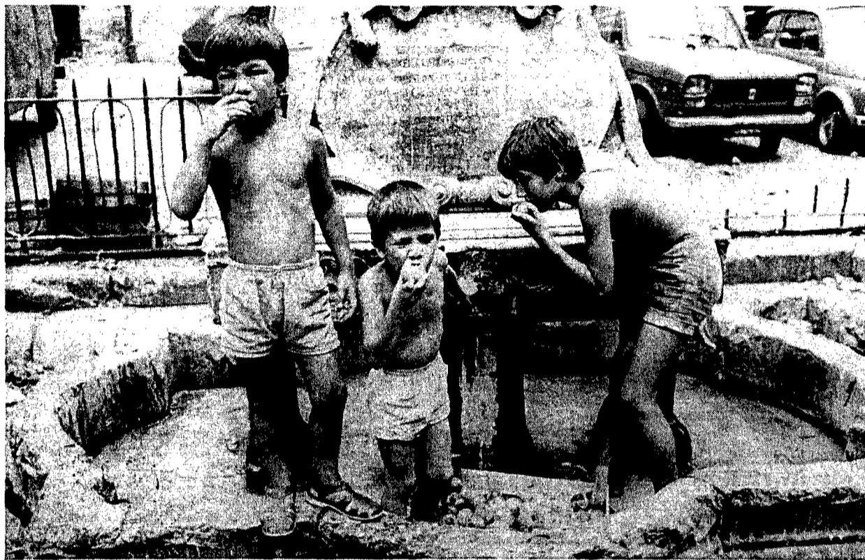
La fontana della Vucciria a Palermo

La vita quotidiana di una grande città sezionata e analizzata con il flash delle inserzioni gratuite pubblicate da un settimanale locale