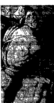
La statua di Pasquino contro l'angolo di palazzo Braschi in un'antica incisione sulle piasquinate del Cinquecento

Finalissima di «liscio» al S. Croce Via i pesi i bilanciari le pesanti macchine da body building la palestra di via Eleonora 2 (S. Croce in Gerusalemme) anche stasera diventerà dopo il 21 una elegante balera «olimpionica» per il giro e il narcisismo del «mejo tacchi» di Roma. Ma il «sabaio danzante» al Centro S. Croce stasera avrà qualcosa di particolare tra le nove coppie selezionate nel corso dei mesi scorsi sarà scelta quella campione che porterà a casa la coppa della finalissima. La giuria sarà composta da istruttori di ballo liscio. Con questa serata si chiude la stagione 86-87 dei corsi di ballo che prenderanno a settembre. Per partecipare telefonare al 774414.