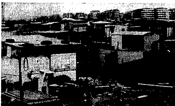
Sullo sfondo delle baracche di Nuova Ostia e, in alto, i palazzoni Armellini, forse altrettanto fatiscenti ma per i quali si chiede un canone esoso