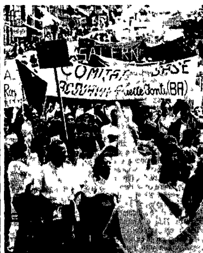
La manifestazione nazionale dei Cobas tenuta a Roma alla fine di maggio