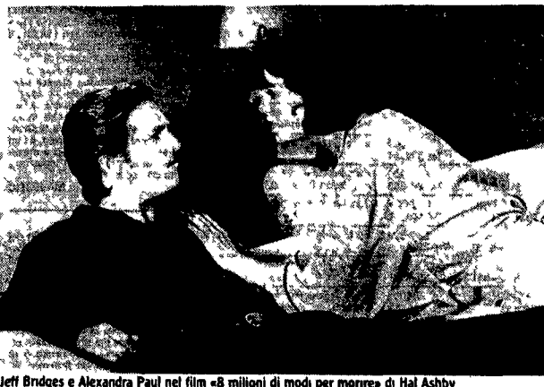
Jeff Bridges e Alexandra Paul nel film «8 milioni di modi per morire» di Hal Ashby